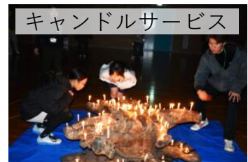
キャンドルサービス